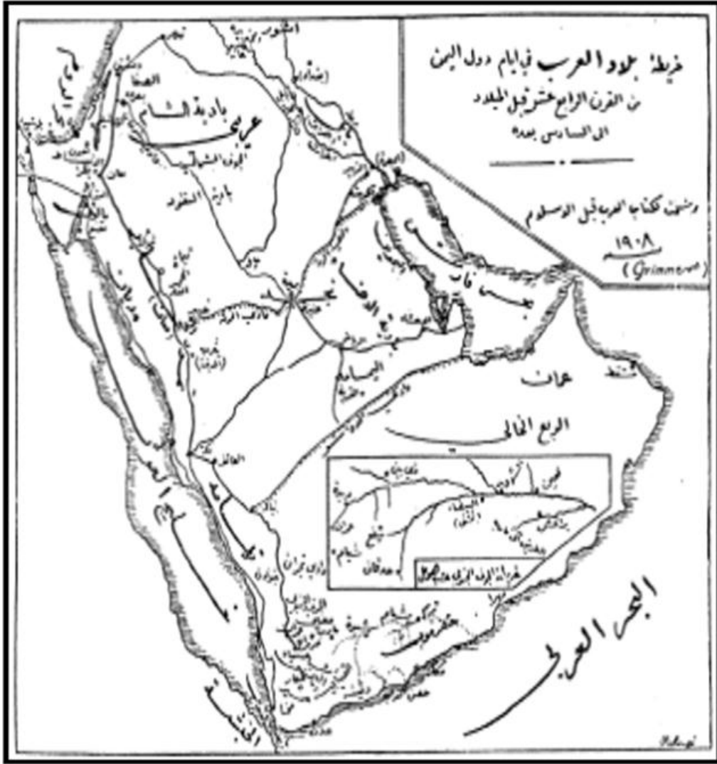
الشكل (4): مملك جنوب جزيرة العرب (52)