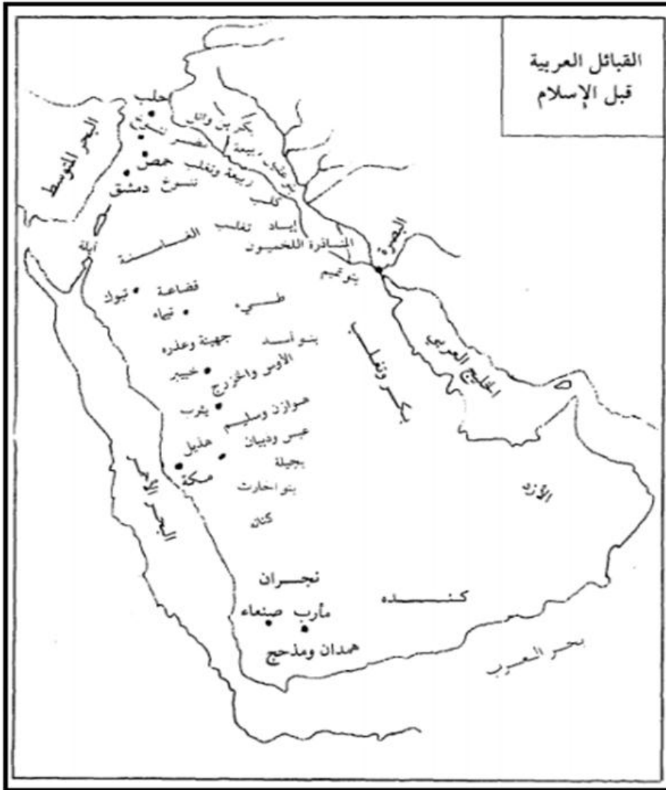
الشكل (3): القبائل العربية قبل الإسلام (52)