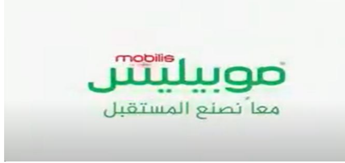
الشكل (05): إشهار موبيليس

شرح الإشهار: قدم الأشهار بلغة عربية فصحة محضة كما أنها تعكس الحياة اليومية للمجتمع الجزائري، ويتم عن الروح الجزائرية.