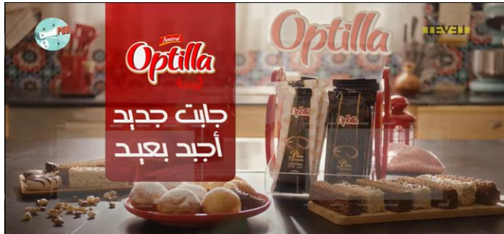
الشكل (03): إشهار Optilla