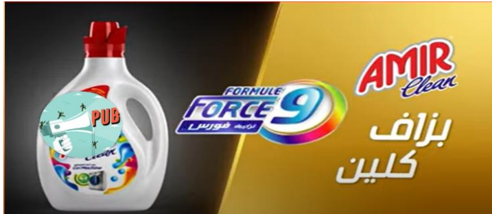
الشكل (04): اشهار AMIR Clean

شرح الاشهار: يبدأ الاشهار بمشهد لامرأة تقدم منتج لغسيل الملابس أمام آلة الغسيل تنادي فيه النسوة من أجل اقتناء المنتج ثم ينتقل المشهد لنسوة اخريات يقمن أيضا بذكر محاسن المنتج، قدمن ذلك في قالب غنائي عصري لا توجد فيه لمسات تعكس قيم المجتمع الجزائري.