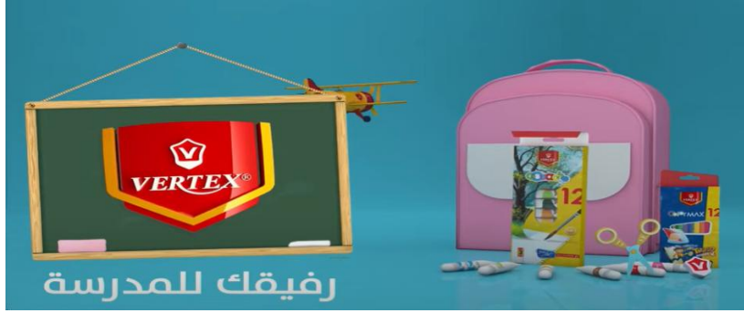
الشكل (02): إشهار VERTEX

- شرح الإشهار: يعرض الاشهار مجموعة من المشاهد لطفلة صغيرة في المرحلة الابتدائية مع أخوها في غرفة تحتوي خزانة ومكتب للأدوات واللوازم المدرسية من كتب وكراسات ومحفظة ومأزر، تقوم بتريد أغنية باللغة العربية الفصحى والعامية القريبة جدا من الفصحى، من أجل الترويج للعلامة التجارية VERTEX المختصة باللوازم المدرسية والمكتبية.