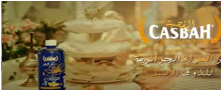
الشكل (06): ماء الزهر القصبية CASBAH

5- عنوان الإشهار: ماء الزهر القصبية CASBAH