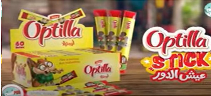
الشكل (07): إشهار Stick TICK Optilla

شرح الاشهار: يقدم الاشهار مجموعة من اللقطات والمشاهد حيث يقوم مجموعة من الأطفال بالترويج للمنتوج، تتضمن اللقطة الأولى طفل صغير هو زعيم مافيا أو عصابة يضع سلسلة في رقبته ولديه حارسان أمنيان صغيران، حيث يكلف الصغار ببيع "ستيك الشكولا" ويطلبهم بإحضار النقود، ثم يبدأ بعد ذلك الأطفال يرقصون ويغنون بمزيج من العامية والفرنسية، صاحب ذلك ديكور لمكان مهجور. اللغة المنطوقة: " واش بعت كامل ستيك اليوم، والي ذاقوا اوبتيلا كفاه؟ ستيك ستيك اوبتيلا غير ليك مع اوبتيلا نحب دايم ستيك وشريكي تارتييني ونزيد عليهم سوف ستيكي طرواصون غرام اوبتيلا داخل مستيكي، اجري شريكي راح تخلاص اوبتيلا ستيكي ستيك اوبتيلا انتيك".