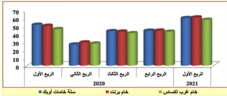
الشكل رقم (01): تطورات أسعار النفوط

يوضح الشكل التالي تطورات أسعار أهم النفوط المتداولة في العالم والمتمثلة في خامات أوبك، خام برنت، وخام غرب تكساس خلا سنة 2020 والربع الأول من سنة 2021، حيث يتضح تقلب اسعار النفط خلال سنة 2020 مع تسجيل تعافي في الربع الأول من سنة 2021.