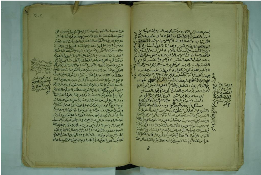
صورة الورقة الأولى من المخطوط