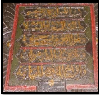
صورة 2: زخرفة كتابية بتقنية الحفر البارز