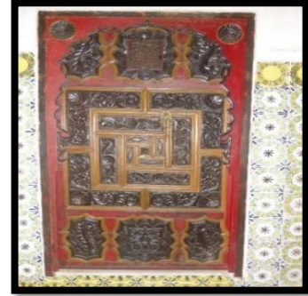
صورة 1: باب خشبي بالقصر