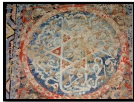
صورة 5: كتابة لأسماء أهل الكهف

شكل 2: تفريغ زخرفي لخط الثلث (عن دحدوح عبد القادر)