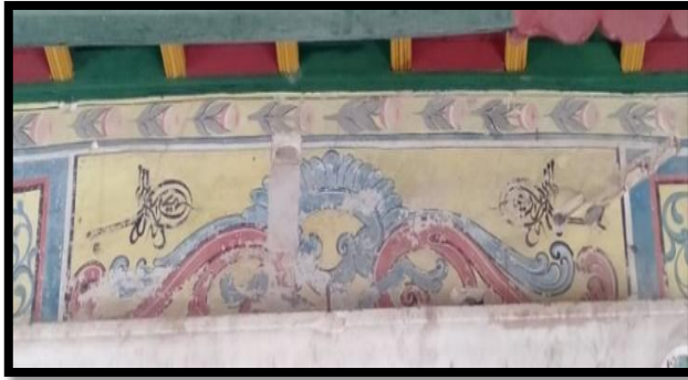
شكل 1: تفريغ يوضح خط الطغراء