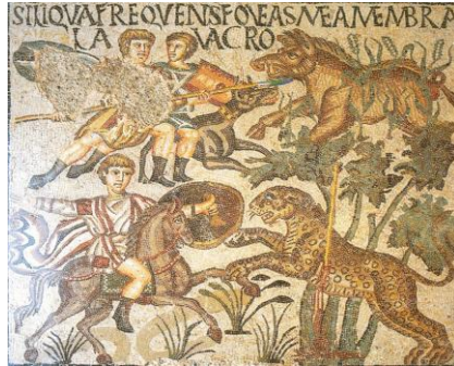
فسيفساء صيد خنزير ونمر، الشلف الجزائر

الظاهر أن عروض الصيد كانت تقام ضمن ألعاب المد رج ملازمة في أغلب الأحيان لألعاب المصارعة، وعلى النقيض من ألعاب المصارعة الرومانية التي كان توقيتها الزمني على عهد الإمبراطور أوكتافوس أغسطس مواكبا لفترة ما بعد الظهر، خصصت الفترة الصباحية لألعاب الصيد 1 ، وغالبا ما كانت هذه الألعاب تنطلق باستعراض فنون وعروض ترويض الحيوانات التي من ضمنها الدببة والفيلة والأسود والفهود، فكانت هذه الحيوانات تقوم بحركات بهلوانية يعجز الإنسان عن أدائها 2 .