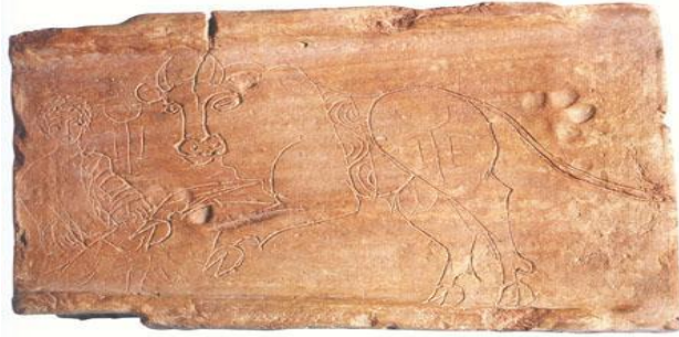
صورة رقم 03 — مصارعة الثيران ممثل على لوح من الطين المشوي (متحف

Blanchard-Lemée (M.) 35 , « VI: Le décor de la maison et des thermes, Décors », dans ALGERIE ANTIQUE , sous la direction de Claude Sintès et Ymouna Rebahi catalogue de l'exposition 26 avril au 17 aout 2003 au Musée de l'Arles et de la Provence antique éditions du Musée de l'Arles et de la Provence antique 2003 p.183