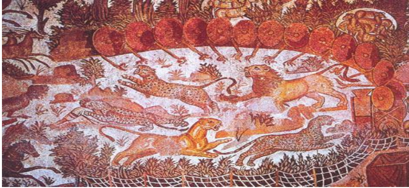
صورة رقم 02 — فسيفساء الصيد من مدينة هييو ريجيوس (عنابة)

Blanchard-Lemée (M.) 35 , « VI: Le décor de la maison et des thermes, Décors », dans ALGERIE ANTIQUE , sous la direction de Claude Sintès et Ymouna Rebahi catalogue de l'exposition 26 avril au 17 aout 2003 au Musée de l'Arles et de la Provence antique éditions du Musée de l'Arles et de la Provence antique 2003 p.183