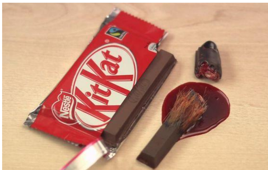
Figure n°3: La photo de Kit Kat détournée par Greenpeace

Source: Anthony Babkine et Mounira Hamdi, Bad buzz: gérer une crise sur les médias sociaux , Paris, Groupe Eyrolles, 2013, p.82.