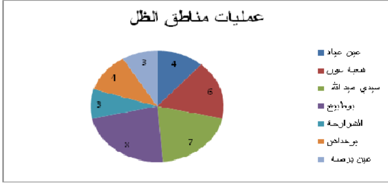
الشكل 1: عمليات مناطق الظل