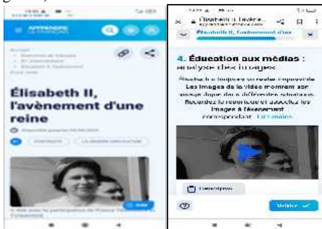
Figure 2: Captures d'écran à partir de la page web Le français TV5-monde

L'enseignant a opté pour la description du portrait de la reine d'Angleterre «Elizabeth II» (Figure 2).