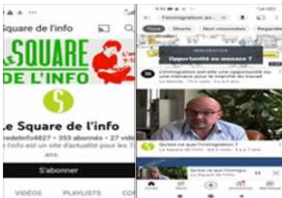
Figure 4: Captures d'écran de la page web «Le square de l'info» sur YouTube

6-4- Quatrième séance: Lors de la quatrième séance, l'enseignant a demandé à ses étudiants de visualiser une vidéo sur un autre réseau social, sur YouTube, portant sur la thématique de l'immigration. L'enseignant leur a demandé de s'abonner à la page «le square de l'info» sur laquelle ils ont pu traiter le sujet de l'immigration, ses causes et ses formes (Figure 4). L'enseignant a procédé de la même façon que dans la première expérimentation, et a divisé la classe en deux groupes et leur a présenté les mêmes consignes.