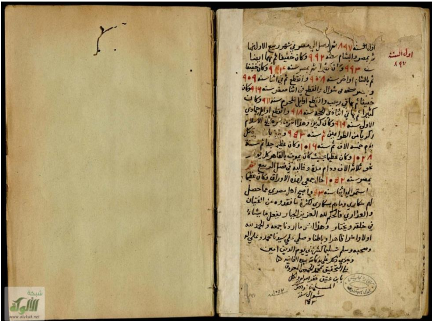
صورة الورقة الأخيرة من المخطوط.