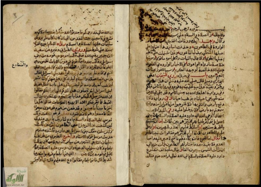
صورة الورقة الأولى من المخطوط

لمحمد بن عبد العظيم الحمصي الشافعي المشهور بابن عتيق الحمصي (ت: 1088هـ) -وصفًا وتقديماً-