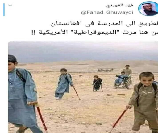
ميمز 12 (تويتر صفحة الدكتور فهد الغويدي 2021/5/12)