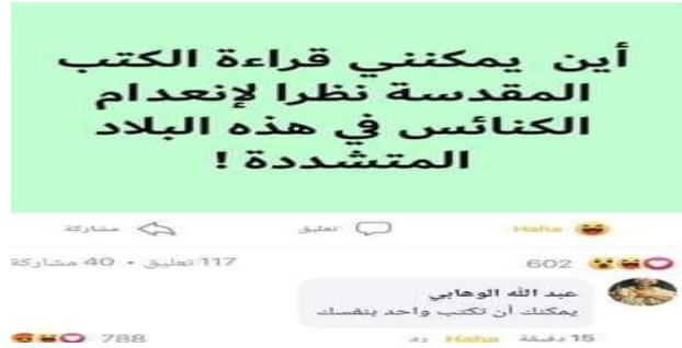
ميمز 11