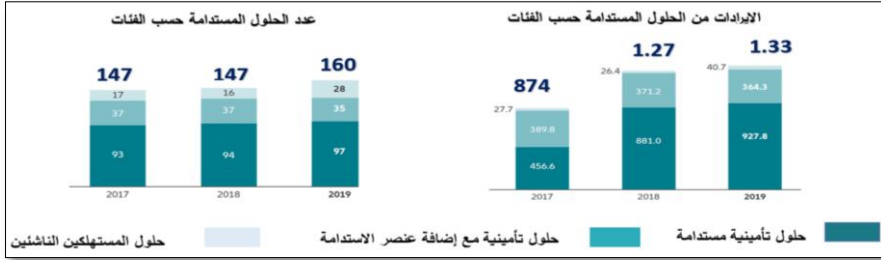
الشكل رقم(06): إيرادات الحلول التأمينية لمجمع أليانز وعددها