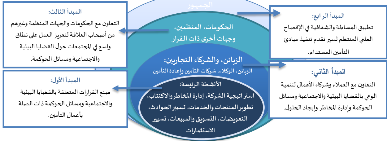
الشكل رقم (03): مبادئ التأمين المستدام