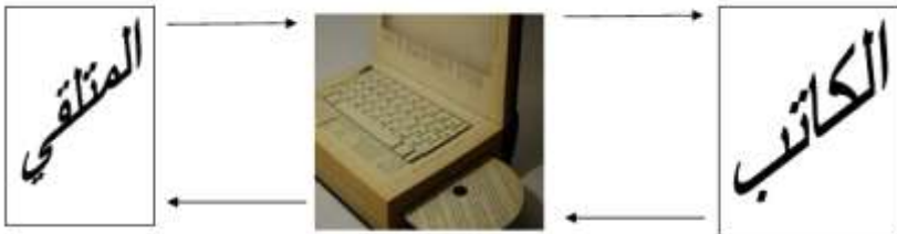
النص التفاعلي: الكاتب يصبح متلقياً والمتلقي يصبح كاتباً

وهكذا يصبح القارئ كاتباً يعيد إنتاج النص انطلاقاً من البداية التي يختارها، ليتلقى الكاتب نصه من جديد باعتباره متلقياً، وهكذا تحدث التفاعلية بين الكاتب والقارئ كما حدثت بين الورقية والرقمية: