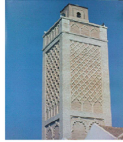
صورة رقم 01 منذاة جامع ندرومة عن: نجاة خدة، علي حفياد، ص 86