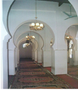
صورة رقم 02 رواق في مسجد ندرومة عن: نجاة خدة، علي حفياد، ص 87