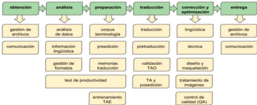
Diagrama n° 1: Modelo actualizado proceso traductor digitalizado del grupo tradumática I

Obviamente, las TIC nos ofrecen un sinfín de herramientas y recursos que podemos explotar como profesores con nuestros estudiantes en el aula de traducción, pero el grupo tradumática afirma por la imposibilidad de llevar al aula cada una de las herramientas asociadas a cada fase y tarea. Por ello, creemos que es imprescindible realizar una selección adecuada de las herramientas que se tratarán e incorporen en el aula de traducción. Esto lo vamos a ver adelante con nuestra propuesta pedagógica.