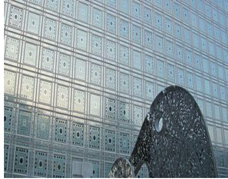
Figure (7) : L'utilisation du système moucharabieh dans l'institut du monde arabe