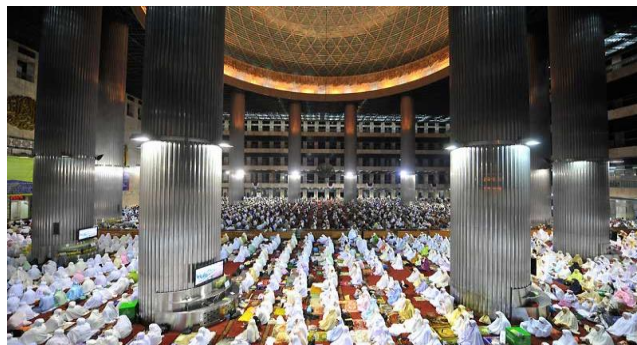
Figure (4) : Piliers des mosquées contiennent des étagères pour livre et des écrans (mosquée à Jakarta)