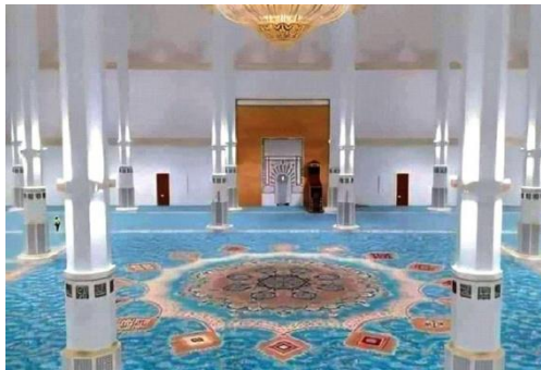
Figure (3) : Salle de prière avec un minimum de colonne, la grande mosquée d'Alger

Nous voyons que la problématique de l'existence des piliers ou non dans une salle prière est liée aux conditions et aux capacités physiques mises en place.