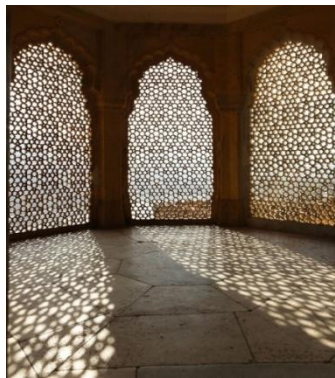
Figure (8) : Moucharbieh