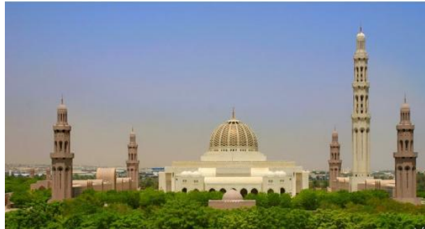
Figure (5) : Implantation des arbres dans la mosquée du Sultan Kabous