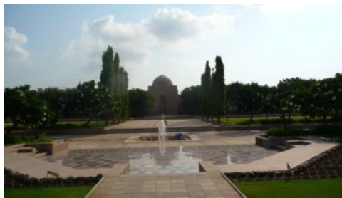
Figure (6) : Implantation des points d'eau dans la mosquée du Sultan Kabous