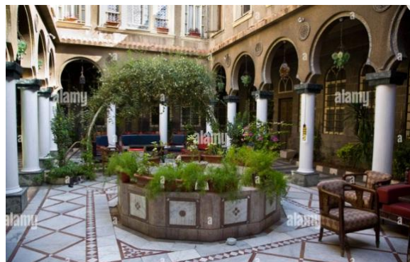
Figure (9) : Maisons modernes à patio