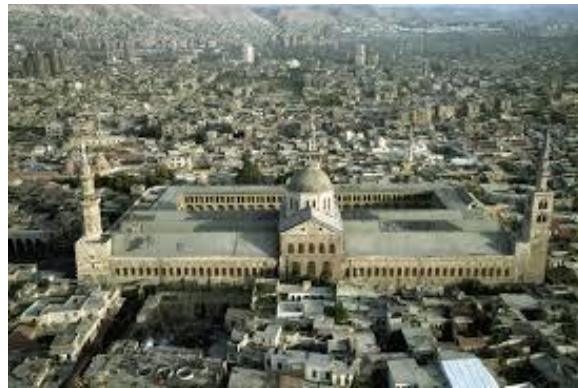
Figure (2) : La forme rectangulaire est la plus convenable pour une salle de prière (la mosquée des omeyyades à Damas)

La source : ministère de la culture française, Musée d'archéologie nationale 2021