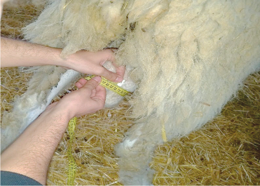
Figure 3 : Circonférence scrotale.