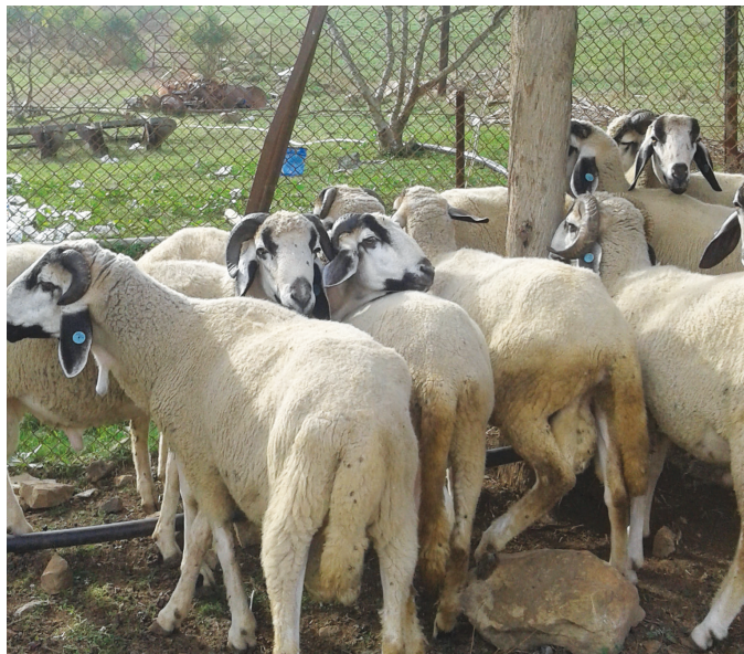
Figure 1 : Lot de béliers expérimental.