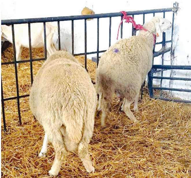
Figure 4 : Evaluation du comportement sexuel du bélier à l'aide d'une femelle attachée en chaleur induite.