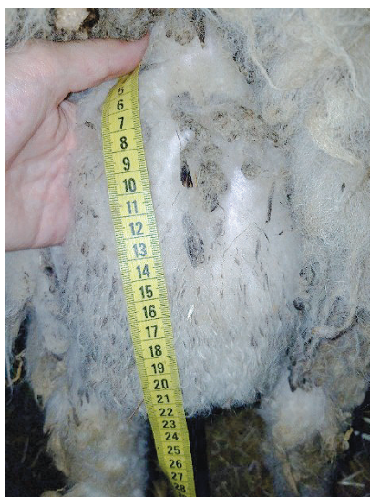
Figure 2 : Longueur testiculaire.