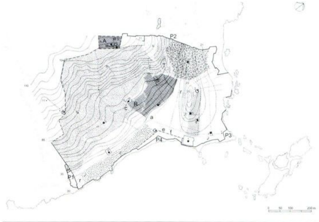
FIG 2 Djaza'ir Bani Mazghanna. Organisation et limites d'extension (avant 1516).

La majeure partie des monuments qui datent de cette période, est disséminée dans la partie basse de la ville, ce qui prouve qu'elle était la plus peuplée et la plus attractive (Fig 02).