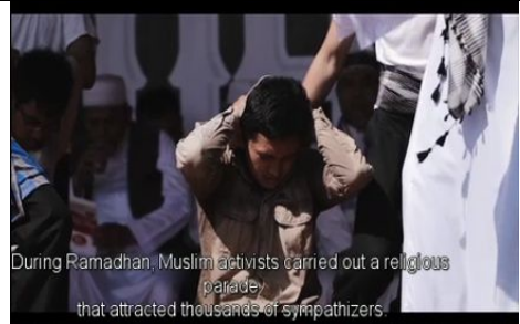
الصورة 7: (plan demi ensemble) لقطة نصف جامعة في أحد المساجد المتشددة، يقوم الإمام بإقامة الحد على أحد الطلاب (35.49_د36.03).