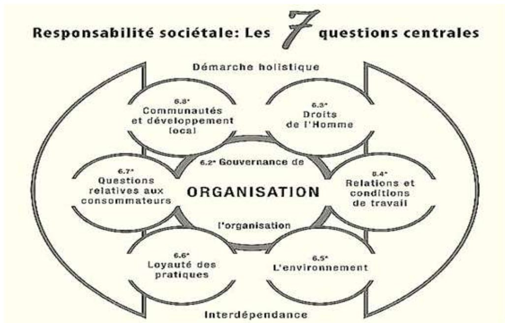
Fig1 : les sept questions centrales de responsabilité sociétale