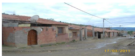
Figure(4): Situation du logement RHP dans la wilaya de Bouira (commune Djebahia)

Suite à l'échec du programme RHP financé par la Banque Mondiale, la wilaya de Bouira était obligée de trouver d'autres moyens afin d'annuler ce genre d'habitations indignes en utilisant