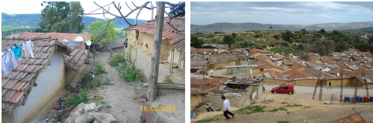
Figure(02): Habitations précaires dans la wilaya de Bouira (commune Djebahia)

La figure 03 montre que le parc précaire de la wilaya de Bouira a été de 33 174 logements en 1999 dont 15419 logements sont de type traditionnel ou construit pendant la période coloniale, et le reste du nombre est réparti sur les autres types de constructions indignes (habitation construites en briques et parpaings ou matériaux hétéroclites). En effet, le nombre de ces habitations se diminue d'une façon progressive, grâce aux efforts des pouvoirs publics pour mettre fin aux problèmes. Néanmoins ce parc est passé de 23442 logements précaires en 2004 à 15434 en 2007 puis 15072 en 2008 et il est arrivé enfin en 2020 à 5116 logements précaires.