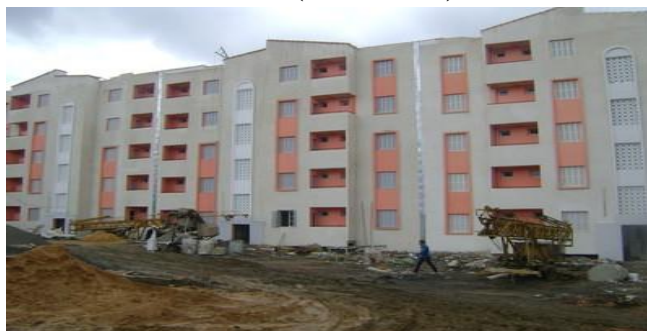
Figure(5): Projets en cours de réalisation (RHP-2008) commune de Djebahia - mai 2011

Le tableau ci-dessus a signalé que d'importants programmes inscrits sont destinés à la résorption de l'habitat précaire à travers tout le territoire de la wilaya de Bouira. Au départ, 2000 logements sociaux (locatif ou participatif) sont programmés au cours du quinquennal 2005-2009 pour la rénovation du secteur de l'habitat dans la wilaya et construire de nouveaux logements pour les ménages de faibles revenus sur toutes les localités de la wilaya de Bouira. D'autre part, les pouvoirs publics de la wilaya ont programmé chaque année un quota supplémentaire pour la construction des logements sociaux destinés au profit des citoyens résidant dans ces gourbis mal sains. Alors, on constate une évolution progressive dans le nombre de logements sociaux désignés à la résorption de l'habitat précaire RHP comme suit : 300 logements pour toutes les localités de la wilaya de Bouira pour l'année 2006, évolué à 1700 logements pour l'année 2007, après on constate une excellente augmentation en 2009 de 2300 logements sociaux, qui touchent la majorité des communes (figure.5).