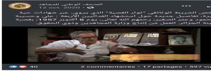
ملحق رقم 06 تبين ملخص شريط وثائقي "ثوار القصبية" يعرض شهادات حية عبر صفحة فيسبوك للمتحف الوطني للمجاهد. (64)