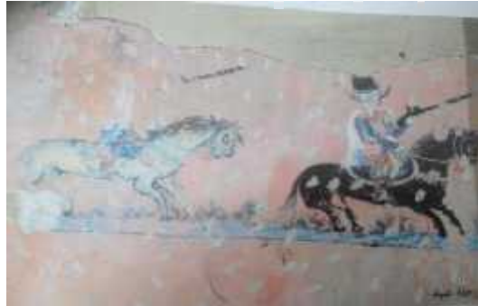
صورة 2: تبيان التصوير الأدمي و الحيواني على الجص

لون الحصان الأمامي باللون الأسود أما الفارس فكان يحمل في يده اليمنى لجام الفارس واليد اليسرى بها البندقية، ويرتدي برنوس أبيض.