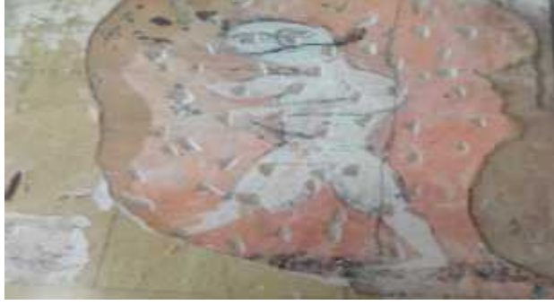
صورة 1: تمثل زخرفة آدمية على الجص

عبارة عن لوحة فنية تمثل فارسان فوق الخيل يحملان بنادق، يوحي المنظر على أنه منظر صيد، وهي تعتبر من الموضوعات التي أقر بها الإسلام في قوله تعالى "يا أيها الذين آمنوا ليلبسونكم الله بشيء من الصيد تناله أيديكم". 94