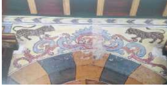
صورة 4: تيين الزخارف الحيوانية على الجص