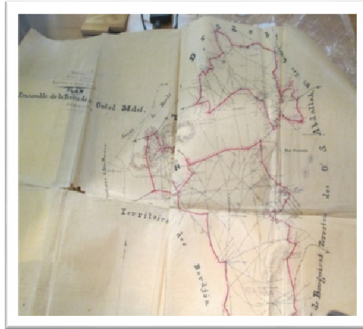
الملحق رقم 1: Territoire de Hassi Memeche Rivoli Concession à Rivoli