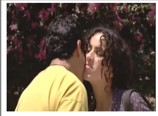
صورة رقم 03

منه، لترد عليها زميلتها بان الحجاب فرضه الله، لكن رشيدة تمادت وقالت بان الله غفور رحيم، فيما ردت عليها زميلتها بان الله شديد العقاب، ليكون الرد من رشيدة شاذا ويسير عكس معتقداتنا الدينية بان الله غفور رحيم، صحيح أن الله غفور رحيم ولكن ليس بذلك المفهوم الذي آمنت به رشيدة وتريد المخرجة إيصاله للجمهور، وهنا بالضبط ماذا كانت تريد المخرجة أن توضح لنا؟ مما لاشك فيه هو أن هذا المشهد دعوة صريحة للتخلي عن الحجاب وتحرر المرأة وإبداء مفاتها، لان حسبها الإيمان في القلب فقط، وهذا التوجه يسير عكس المنظومة الفكرية والدينية للمجتمع الجزائري لأنه مجتمع واعى ومتيقن أن الإيمان في الفعل و القول .