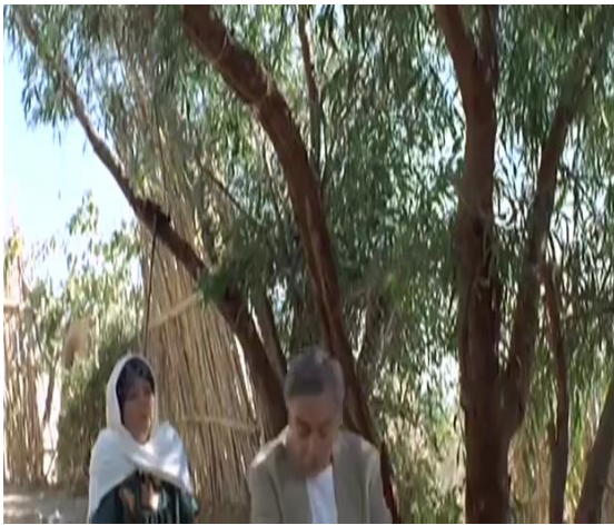
الصورة رقم 07

على المرأة وكذا شهادته وطاعة الأبناء لأبائهم، فحين تعلق كلمة المرأة فإنما حتما تعرب عن شذوذ لا تقبله البيئة ويكون الرجل تفهقر إلى وضع المعرة 9 انظر الصورة 6