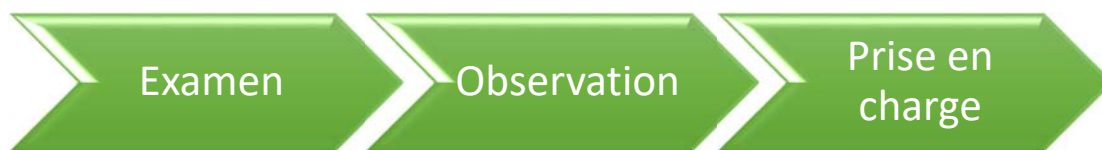
Figure 1 : Processus des débats du projet du système comptable au sein du Groupe de travail algérien

Le procédé reste identique durant toute la phase des travaux. Il peut être synthétisé comme suit :