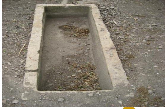
صورة رقم (04): بقايا قلعة تيفاش