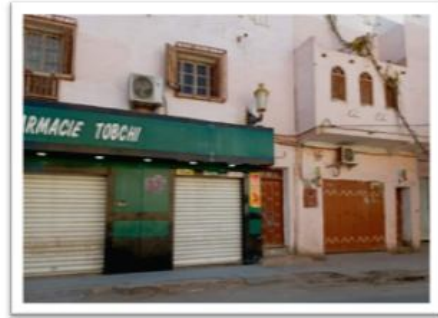
صورة رقم (04) تبين منازل محلات حلت بدل سور القصر العتيق (حي بني واقين).