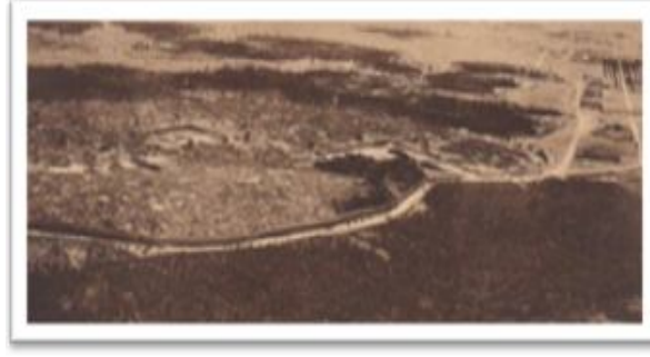
صورة رقم (02) تبين سور القصر العتيق عندما كان قائم، تحيط به البساتين وغابات النخيل