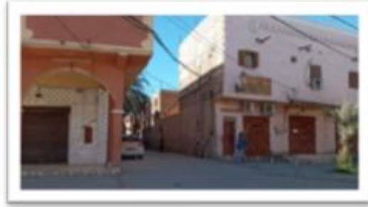
صورة رقم (03) تبين فتح شارع حديث لمرور المركبات (حي بني وقين)

مفهوم التخطيط العمراني الذي يعتمد في الأساس على الواقع البيئي إلى جانب قيم وعادات وأنماط الحياة الاجتماعية السائدة 29 . ومع أن التغيير الثقافي حقيقة وجودية، فضلاً عن أنه ظاهرة عامة وخاصية أساسية تتميز بها نشاطات الحياة الاجتماعية، بل أنه ضرورة حياتية للمجتمعات البشرية فهو سبيل بقائها ونموها، فبالتغيير الثقافي يتهيأ لها التكيف مع واقعها ومحيطها، وبالتغيير يتحقق التوازن و الاستقرار في أبنيتها وأنشطتها 30 .