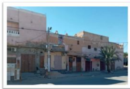
صورة رقم (05) تبين منازل محلات حلت بدل سور القصر العتيق (حي بني سيسين)