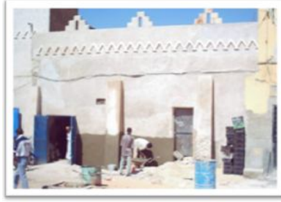
صورة رقم(06) تبين استمرار عمليات إخفاء ما تبقى من السور بفتح ابواب للمنازل ومحلات تجارية.

توضح كل من الصورة رقم (04) والصورة رقم (05) كيف أن سور القصر لم يعد موجود وحلت محله مساكن ومحلات تجارية متعددة الخدمات بفعل التحضر، كما تم فتح شوارع وممرات جديدة تؤدي إلى القصر مما أدى إلى تدهور سور القصر وتلاشيه ، هذا التغيير في البنية العمرانية لسور القصر العتيق أدى إلى تغيير وظائفه التقليدية المعروفة إلى وظائف جديدة.