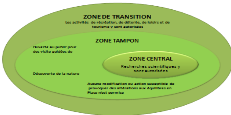
Fig 1 ; nouveau zoning des Aires Protégées

Dans l'article 15 ; elle définit un nouveau zoning pour les Aires protégées. qui comporte de trois zones, une zone central qui recèle des ressources où seul la recherche scientifique est autorisé , une zone tampon Utilisée pour des pratiques écologiquement viables, y compris l'éducation environnementale, les loisirs, l'écotourisme et la recherche applicable , et une zone de transition Elle protège les deux premières zones et sert de lieu de détente et de loisir .