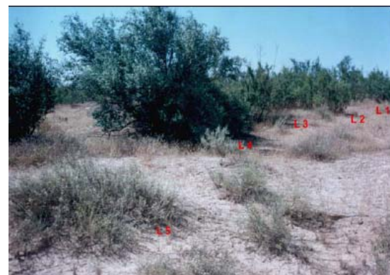
Photo 3 : Ligne de plantation en Olivier de Bohème et en Tamarix après 15 ans de mise en place du dispositif

Le taux de réussite des plantations est satisfaisant pour les quatre espèces. Le Tamarix articulata a réalisé 70% pour les boutures racinées et 40% pour les boutures non racinées (photo 3) et un accroissement annuel en hauteur très appréciable avec 50 à 70 cm, durant les quatre premières années. L'olivier de bohème marque également un taux de réussite important et un accroissement annuelle en hauteur + 70 cm/an. Enfin la hauteur moyenne des plants est importante pour les quatre espèces (voir tab. II).