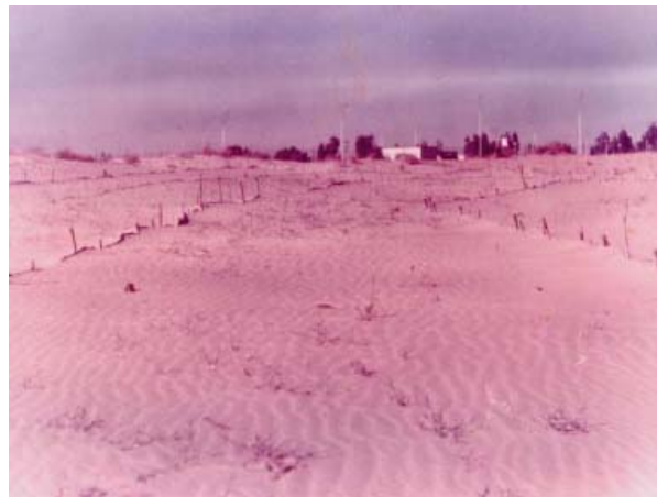
Photo 1 : Stade initial du voile sableux juste après la mise en place du film plastique et de la plantation

Mise en place du film plastique : Les lignes tracées en courbes de niveau et perpendiculairement aux vents efficaces, sont sillonnées par des tranchées creusées à 30 à 35 cm de profondeur et 20 à 30 cm de largeur, pour abriter le film plastique. L'espacement entre les fossés est de 4 à 5 m. Des piquets en bois enfoncés à une profondeur de 80 cm, tout le long du réseau de carroyage, sont destinés au tuteurage de la palissade ( photos 1 ).