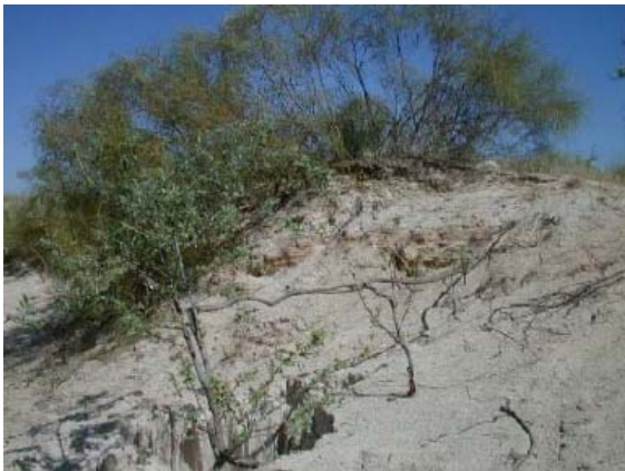
Photo 4 : Déchaussement des racines d'un sujet d'Olivier de Bohème sur une longueur de 4 m, environ provoqué par l'action des vents

Enfin, concernant la fixation biologique, les résultats obtenus sont très satisfaisants, nous avons enregistré un taux de recouvrement végétal très appréciable (soit > 70% en 1987), dépassant largement le taux optimal de 30% exigé [17.18], rappelons à ce sujet que, l'érosion éolienne commence à se manifester, si le