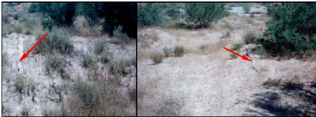
Photo 2 : Présence du film plastique après 15 années d'installation

Pour assurer la solidité du dispositif, le film plastique doit être bien tendue et soutenu par les piquets en bois. Les plants sont par la suite mis en terre de part et d'autres du film plastique dans les fossés, selon la densité choisie, soit 1.5 à 2 m et enfin les tranchées sont comblés avec du sable humide (Photo 2) [5. 6].